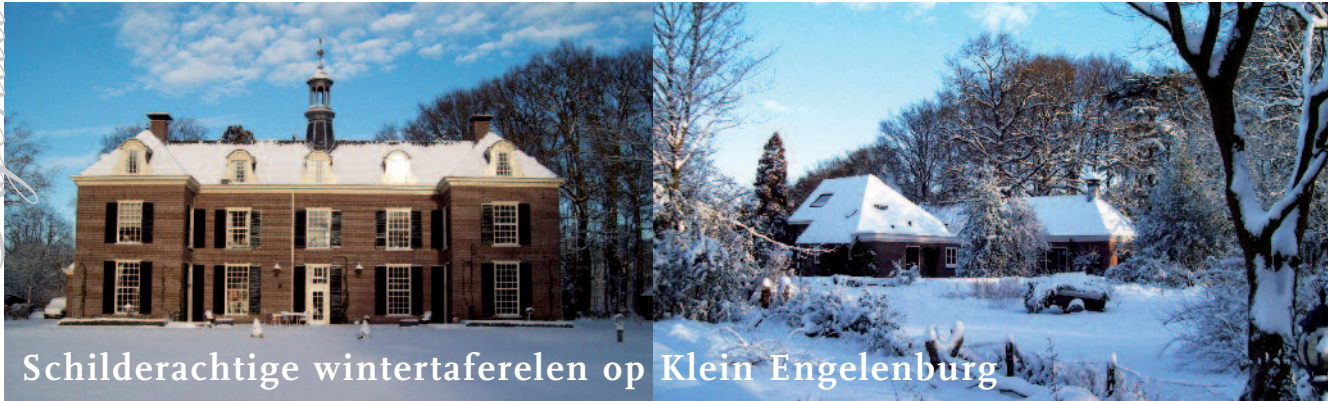
Schilderachtige wintertaferelen op Klein Engelenburg