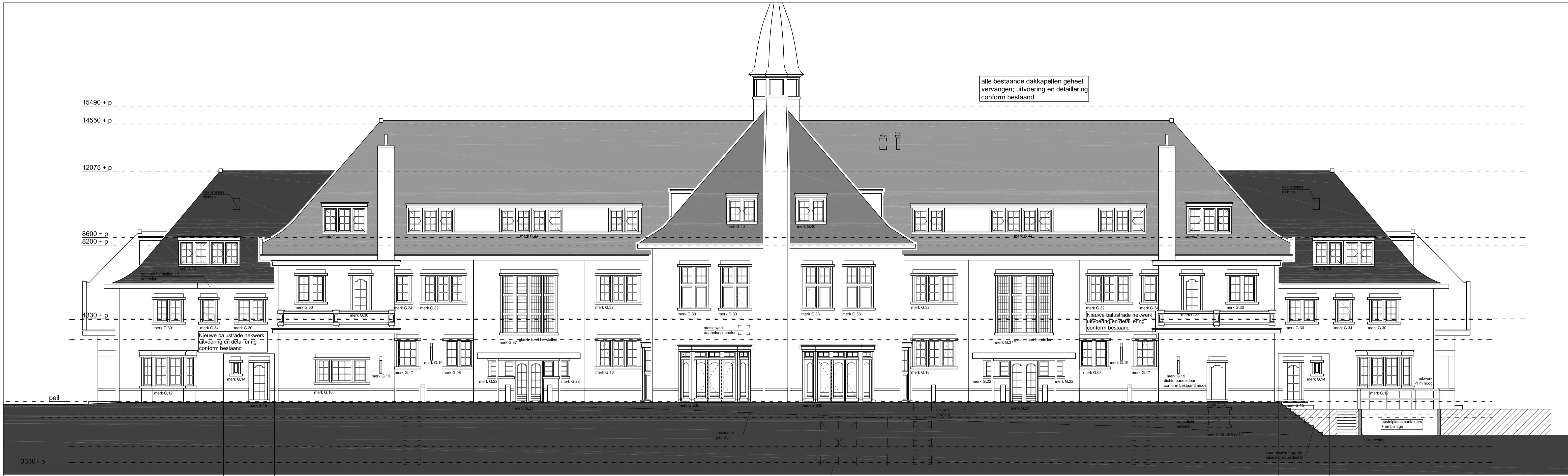
Achtergevel Nieuw (Noord-Oostgevel)

kozijnen 60 minuten WBDBO brandwerend uitvoeren, zie plattegronden